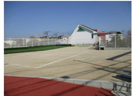
2018年完成 なかよし広場

保育園名は さくらの名所として知られる玉川学園にふさわしく、玉川さくら保育園と名づけられました