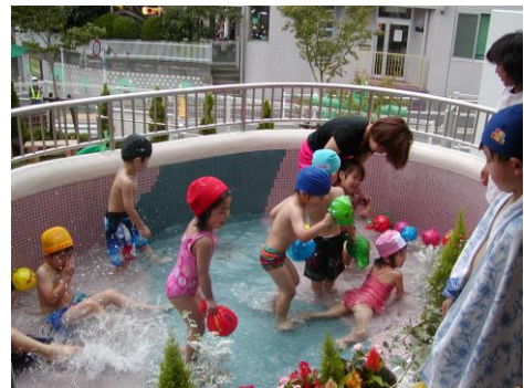
散歩の後のプールって最高！