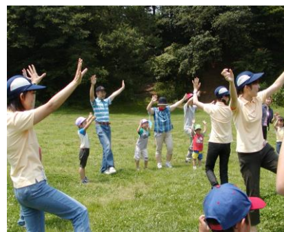
遠足での親子体操

それは、子どもそのものであり、子ども達がお互いにふれあって、現在を最もよく生き、素晴らしい未来をつくりだすことを願って名づけられたものです。